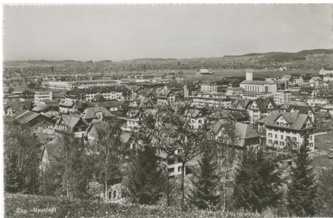
P 308.11.38.1 Zug: Neustadt: Bildseite

Als zentrales Archiv des Kantons sichert das Staatsarchiv Zug die langfristige Nachvollziehbarkeit staatlichen Handelns. Durch die Erhaltung, Erschliessung und Vermittlung von Unterlagen mit bleibendem Wert trägt es zum Verständnis von Vergangenheit und Gegenwart bei und stärkt Vertrauen in Rechtsstaat und Demokratie.